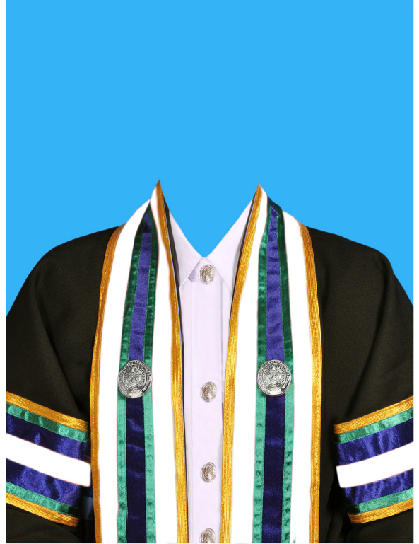
นิติศาสตรบัณฑิต (สีขาว) (#FFFFFF)