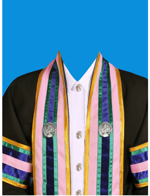
บริหารธุรกิจบัณฑิต (สีชมพู) (#FEB1C5)