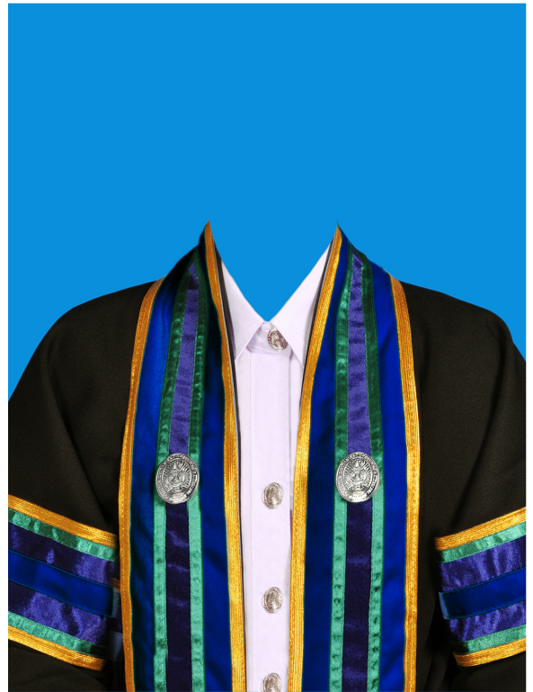
นิเทศศาสตรบัณฑิต (สีน้ำเงินเข้ม) (#00047D)