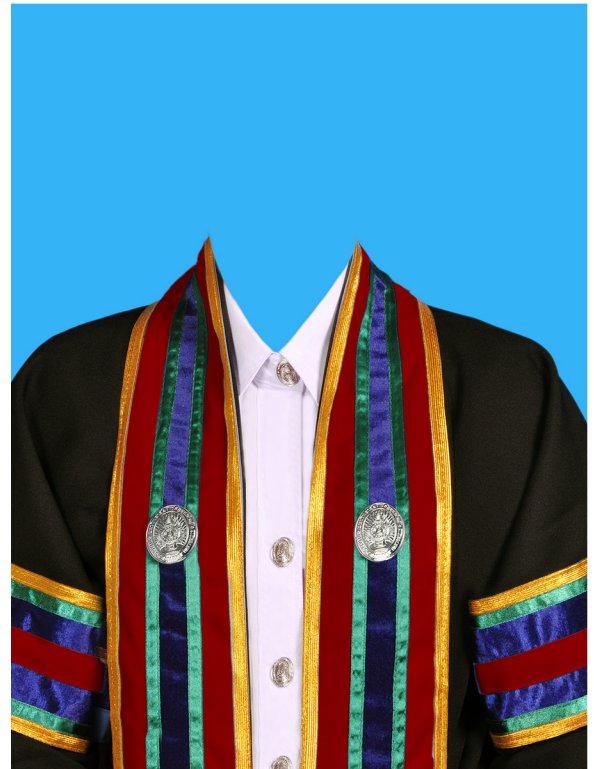
วิศวกรรมศาสตรบัณฑิต (สีเลือดหมู) (#941F18)