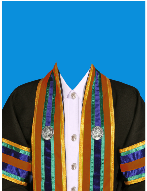
รัฐประศาสนศาสตรบัณฑิต (สีน้ำตาล) (#8E4214)