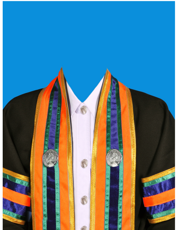
ศิลปศาสตรบัณฑิต (สีแสด) (#FF6119)