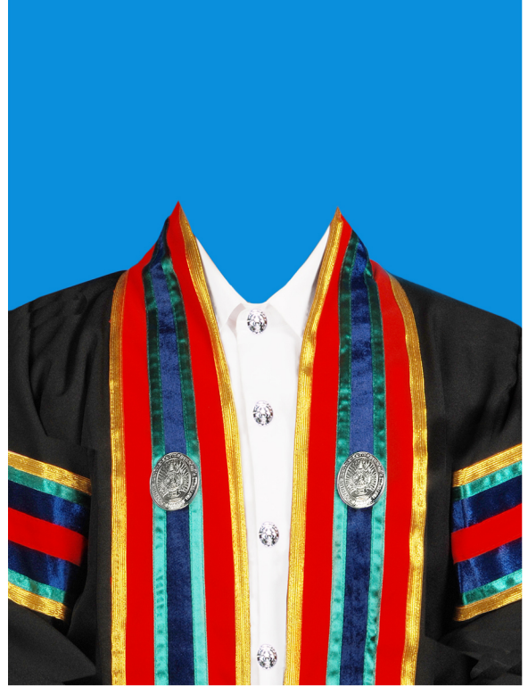
ศิลปบัณฑิต (สีแดงเลือดนก) (#EA0101)