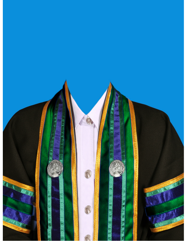
เศรษฐศาสตรบัณฑิต (สีเขียวปีกแมลงทับ) (#OE4D40)