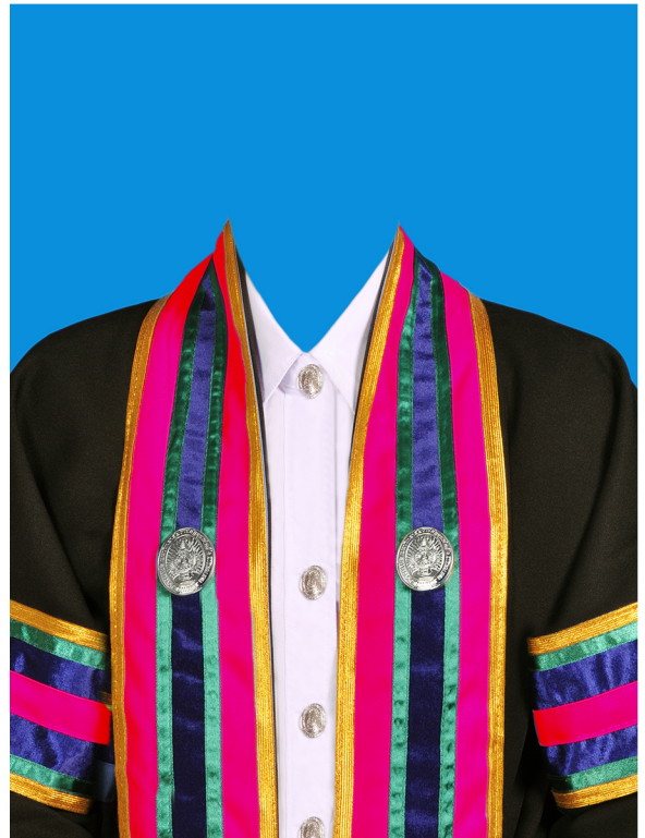
สาธารณสุขศาสตรบัณฑิต (สีบานเย็น) (#D20067)