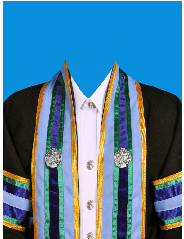
บัญชีบัณฑิต (สีฟ้าเทา) (#9FB2EA)