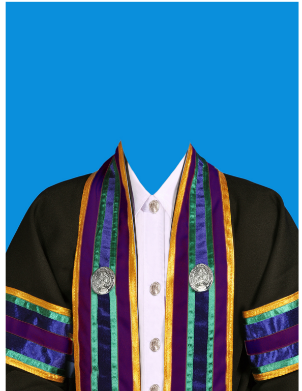
เทคโนโลยีบัณฑิต (สีม่วง) (#442446)