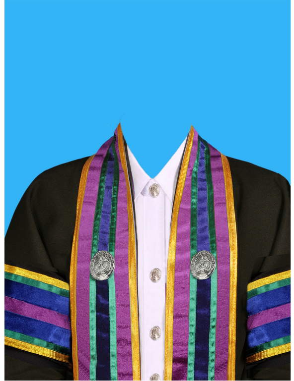
พยาบาลศาสตรบัณฑิต (สีม่วงอมชมพู) (#A04C97)