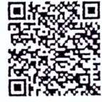
ประกาศกระทรวงฯ