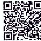
คู่มือและแนวปฏิบัติฯ

สำนักบูรณาการกิจการการศึกษา กลุ่มกิจการพิเศษ โทร/โทรสาร ๐ ๒๖๒๘ ๖๔๐๐